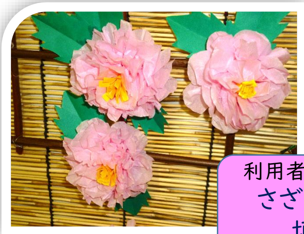
利用者様作品集 さざんかの 垣根