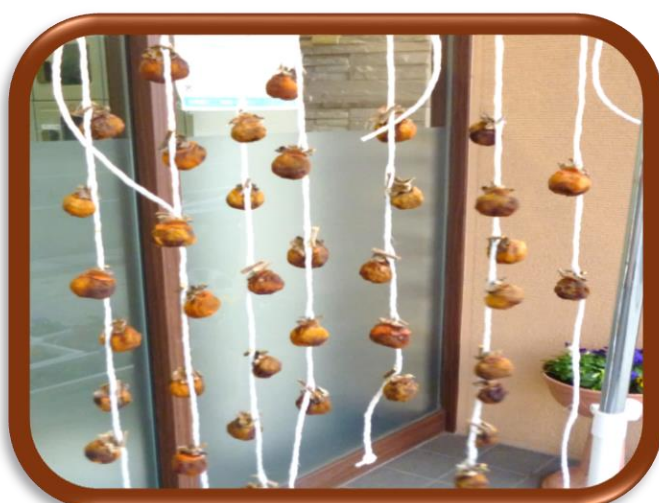
玄関先に干してます！