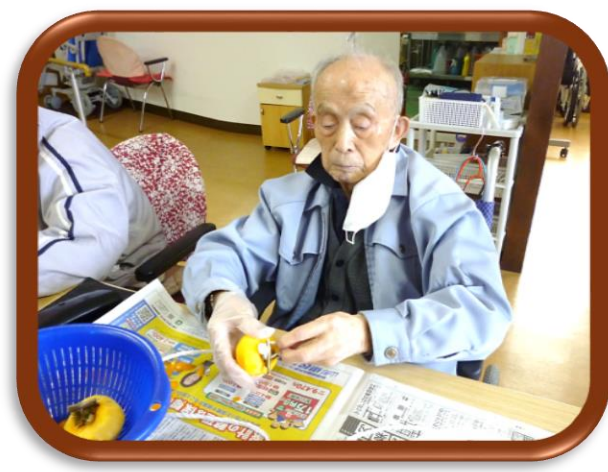
柿の皮むきはさすがに手際よくプロ級(*_*) 上手いですね～