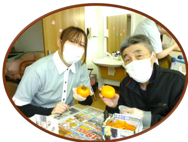
この柿で干し柿つくります

10月も終わりがち、利用者様と一緒に干し柿づくりを行いました。ひとつひとつ丁寧に皮をむき、紐に掛けてラックに吊るす作業を皆さんで協力して行いました。朝晩と日中の気温差もある中、天気を見ながらゆっくりと干し柿づくりを行いました。その甲斐もあって、とても甘くて柔らかい干し柿が完成しました(*_*)