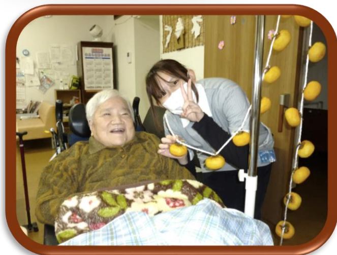
つるし柿の出来上がり～