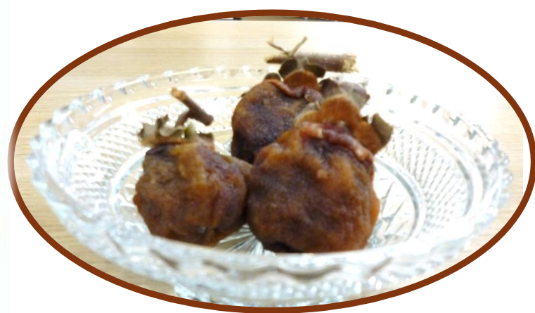
1 か月ほどでこんなにおいしそうな干し柿ができました！